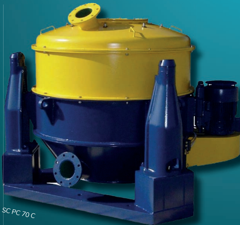
SC PC 70 C